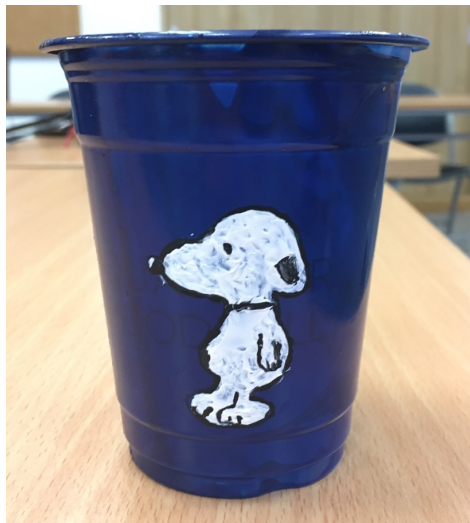
ภาพ ๔.๓ ที่ใส่ดินสอจากแก้วพลาสติก (เป็นส่วนหนึ่งของที่ใส่ดินสอ ชุดที่ ๑)