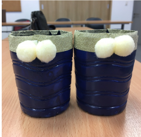
ภาพ ๔.๒ ที่ใส่ดินสอจากแก้วพลาสติก (เป็นส่วนหนึ่งของที่ใส่ดินสอ ชุดที่ ๑)