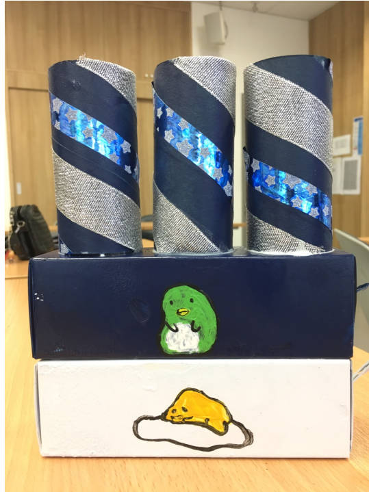
ภาพ ๔.๔ ที่ใส่ดินสอจากกล่องขนมและแกนกระดาษชำระ (เป็นส่วนหนึ่งของที่ใส่ดินสอ ชุดที่ ๒)