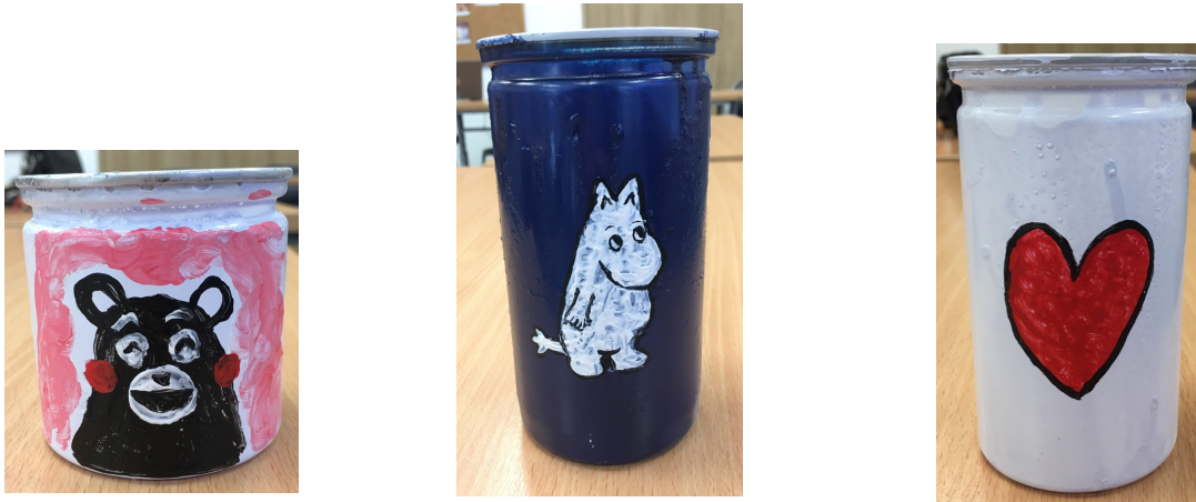
ภาพ ๔.๑ ที่ใส่ดินสอจากขวดพลาสติก (เป็นส่วนหนึ่งของที่ใส่ดินสอ ชุดที่ ๑)

ผลของการประดิษฐ์สิ่งของ แสดงให้เห็นว่า เราสามารถนำวัสดุเหลือใช้มาประดิษฐ์เป็นที่ใส่เครื่องเขียนชนิดต่างๆได้ โดยที่สิ่งประดิษฐ์ที่ทำนั้นสามารถนำมาใช้ประโยชน์ได้จริง โดยผลของการประดิษฐ์สิ่งของที่ได้ทำจากโครงการนี้ ได้แก่