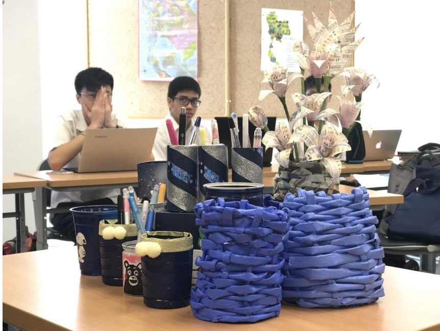
ภาพ ๔.๖ ผลงานทั้งหมด (วางกับสิ่งประดิษฐ์กระถางต้นไม้ของกลุ่มอื่น)

จากภาพที่ ๔.๑ - ๔.๖ สามารถเห็นได้ว่า สิ่งประดิษฐ์ทุกชิ้นที่ได้มาจากการทำโครงการ มีความสวยงาม และสามารถใช้ได้จริง นอกจากสิ่งประดิษฐ์ในภาพข้างต้นแล้ว ทางคณะผู้จัดทำก็ได้ทำที่ใส่ดินสอจากกล่องซีเรียลและแกนกระดาษชำระ แต่ไม่ได้ถ่ายภาพไว้ ถึงกระนั้น ผลการทำโครงการของที่ใส่ดินสอดังกล่าว ก็เป็นเช่นเดียวกับสิ่งประดิษฐ์ในรูปข้างต้น กล่าวคือ มีความสวยงาม และสามารถนำมาใช้ได้จริง